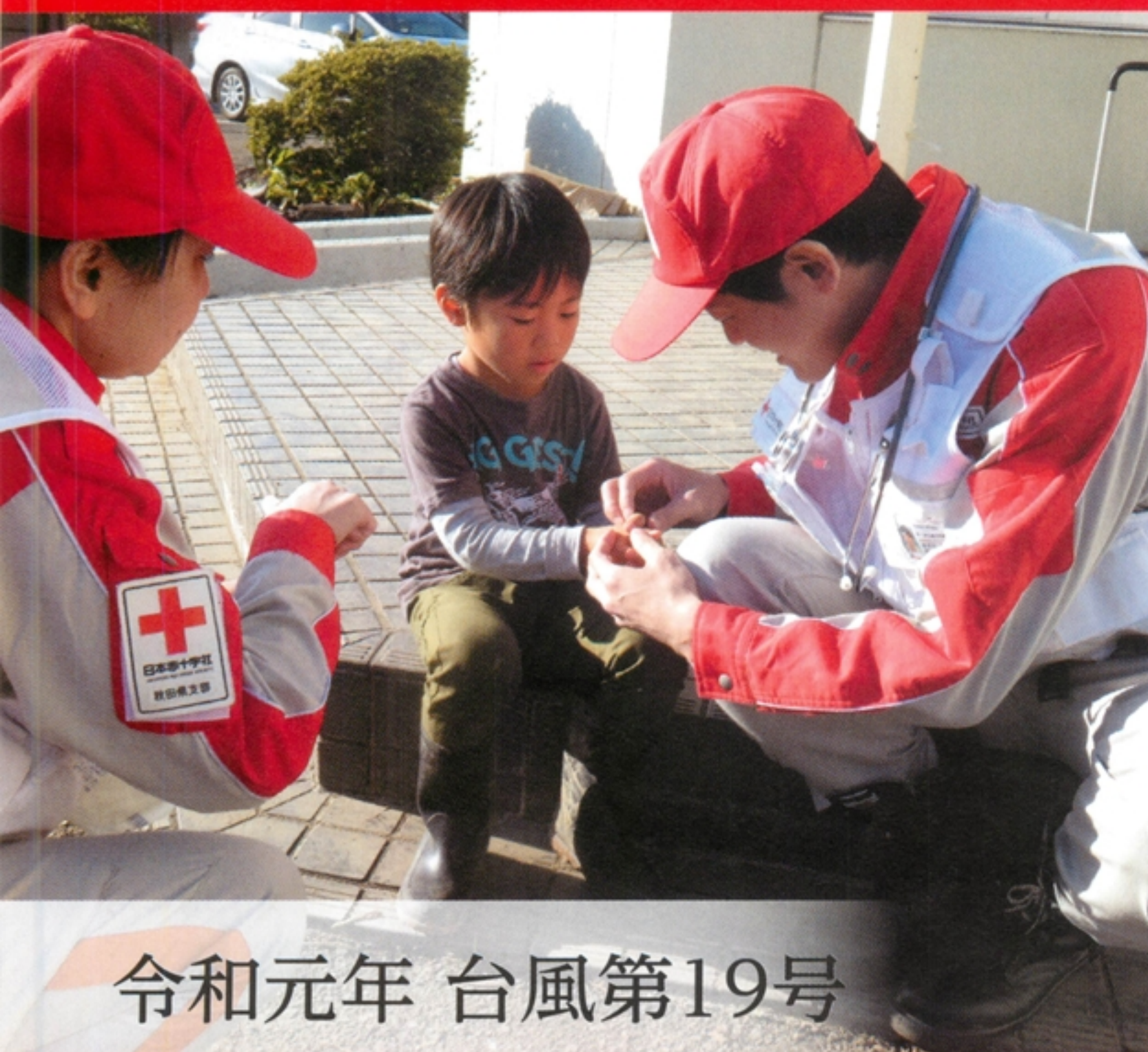
令和元年 台風第19号