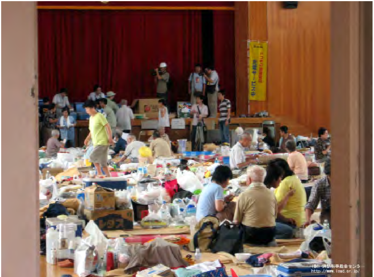
2007年7月18日新潟県中越沖地震柏崎市内の避難所内の様子